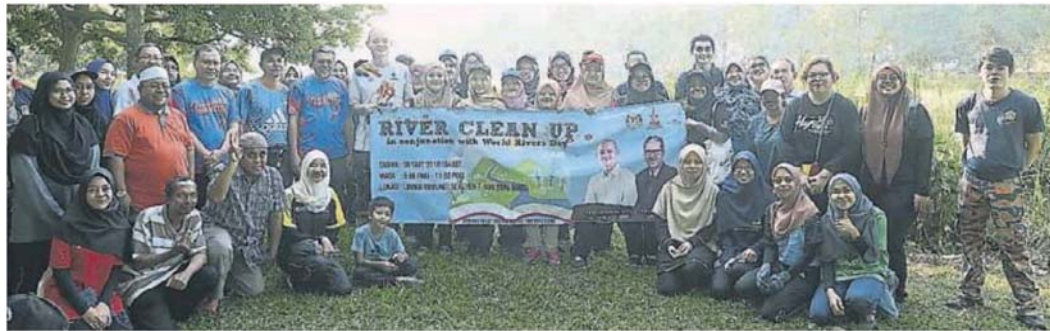
博特拉大学生与当地国州议 员，配合世界河流日清理冷岳 河。

（万宜30日讯）国际贸易及工业部副部长王建民说，大部分滤水站，是依靠河流输水，继而提供净水给人民使用，因此每人都需爱惜河流，勿让河水遭到污染。