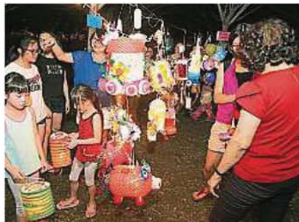
▲参与环保灯笼制作比赛的参赛者发挥无限创意,制作精致美丽的灯笼。