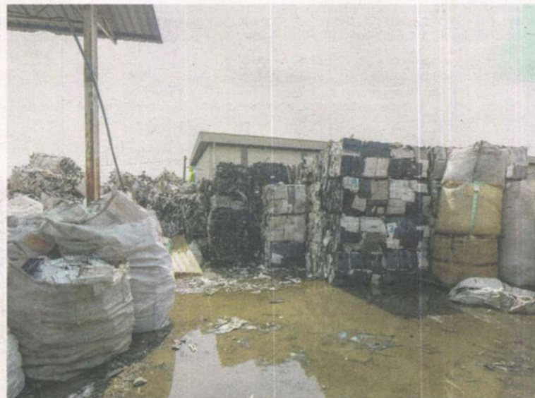
LONGGOKAN sisa plastik di sebuah kilang haram yang beroperasi di Telok Panglima Garang, Kuala Langat baru-baru ini.

rasi di sekitar Kuala Langat dan memberi jaminan akan menutup kilang-kilang haram tersebut.