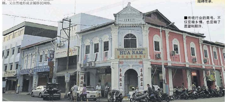
■传统行业的商号，不仅反映乡情，也反映了愿望和期许。