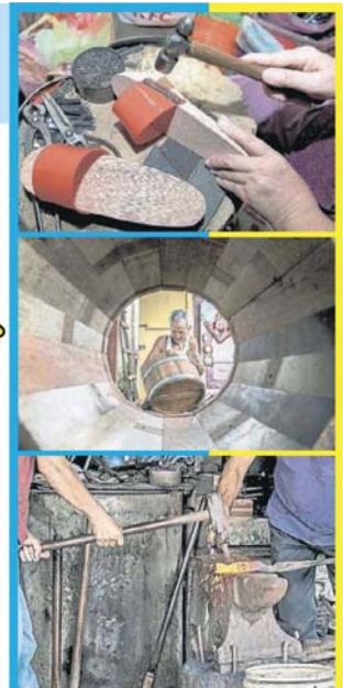
■传统行业多数数小本经营，依靠手藝或出賣勞力干活。

此外，“先来后到”也直接影响行业的操控。迟来的华民（海南、福州和兴化）下南洋，许多行业已为其他方言群体霸占，他们能从事行业有限，海南人唯有“打洋工”，即是在洋人和富裕