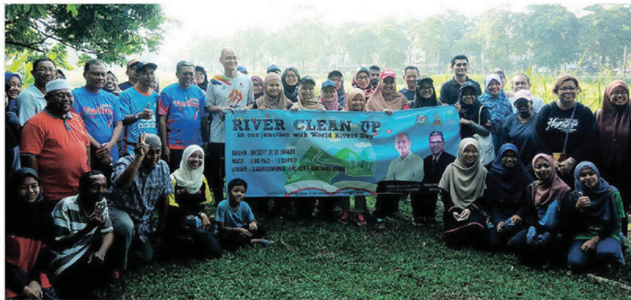
Antara peserta yang terlibat dalam program River Clean Up.

naan bertujuan meningkatkan kesedaran orang ramai terhadap pemuliharaan dan keindahan sungai.