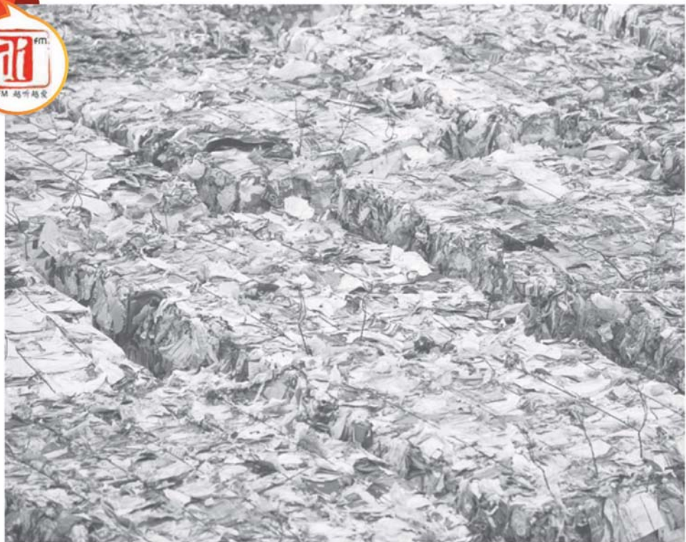
自中國拒收「洋垃圾」後，大馬等東南亞國家正成為西方發達國家的替代垃圾場。

題是雪州政府並不知道實際的洋垃圾進口數量，因為沒有權限去處理進口准證的問題，進口准證並不在雪州政府的權限之內，更不在市政府的權限。