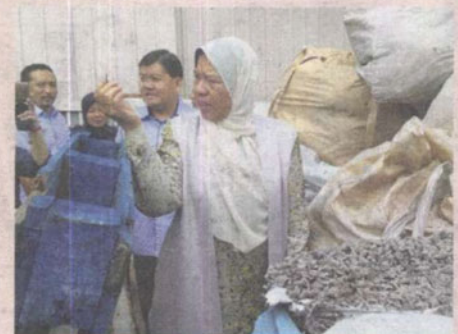
ZURAIDA melawat kilang memproses sisa plastik di Telok Panglima Garang, Kuala Langat baru-baru ini.

Menteri Besar itu berkata demikian bagi mengulas pengumuman Menteri Perumahan dan Kerajaan Tempatan,