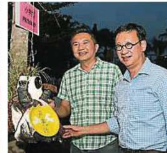
▲左图:小朋友点蜡提灯笼,玩得很开心。