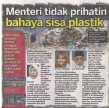
KERATAN Kosmo! 26 September 2018.

tempatan, kita telah menutup banyak kilang haram dan penutupan kilang akan dibuat secara berperingkat," tegas beliau. Kosmo! sebelum ini mendedahkan kebimbangan penduduk Kuala Langat apabila pihak berkuasa membiarkan 41 daripada 54 buah kilang sisa plastik di daerah itu beroperasi tanpa lesen. Kesan aktiviti memproses sisa plastik dalam tempoh kira-kira dua tahun itu menyebabkan kira-kira 300,000 penduduk di daerah berkenaan berdepan masalah kesihatan termasuk ber-